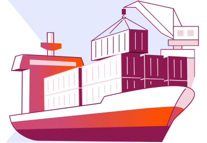
Nihai alıcılar (deniz taşımacılığında)