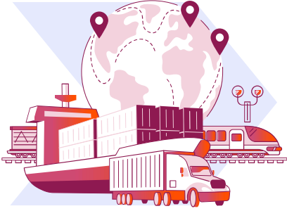
Denizler ve iç sular, kara yolları ve demir yollarında faaliyet gösteren nakliye şirketleri